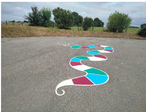
Jeux au sol