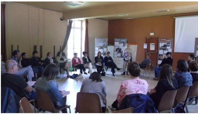
Session de formation sur les Gens du voyage pour tous les partenaires