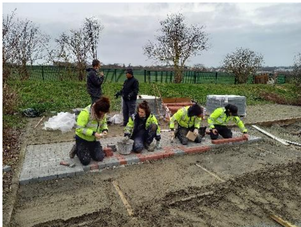
Chantier école : formation dallage- pavage