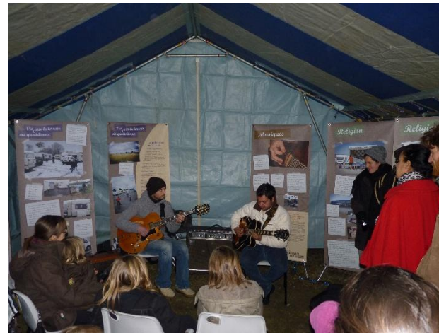
Inauguration de l'exposition « Brèves de caravanes » sur l'aire d'accueil