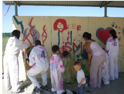
Réalisation d'une fresque murale sur l'aire avec les voyageurs et les jeunes