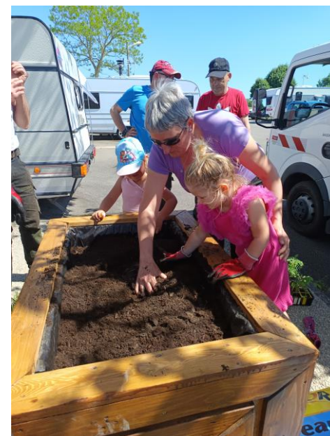
Pose de jardinières + atelier plantation