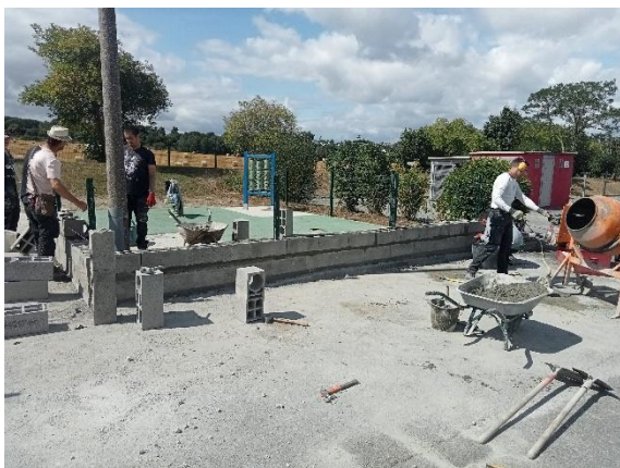
Fabrication du muret à l'aire de jeux