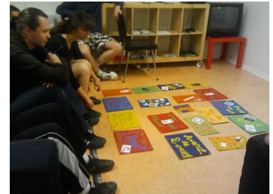
Action de sensibilisation sur la culture des gens du voyage avec les Espaces Jeunes et AGV35