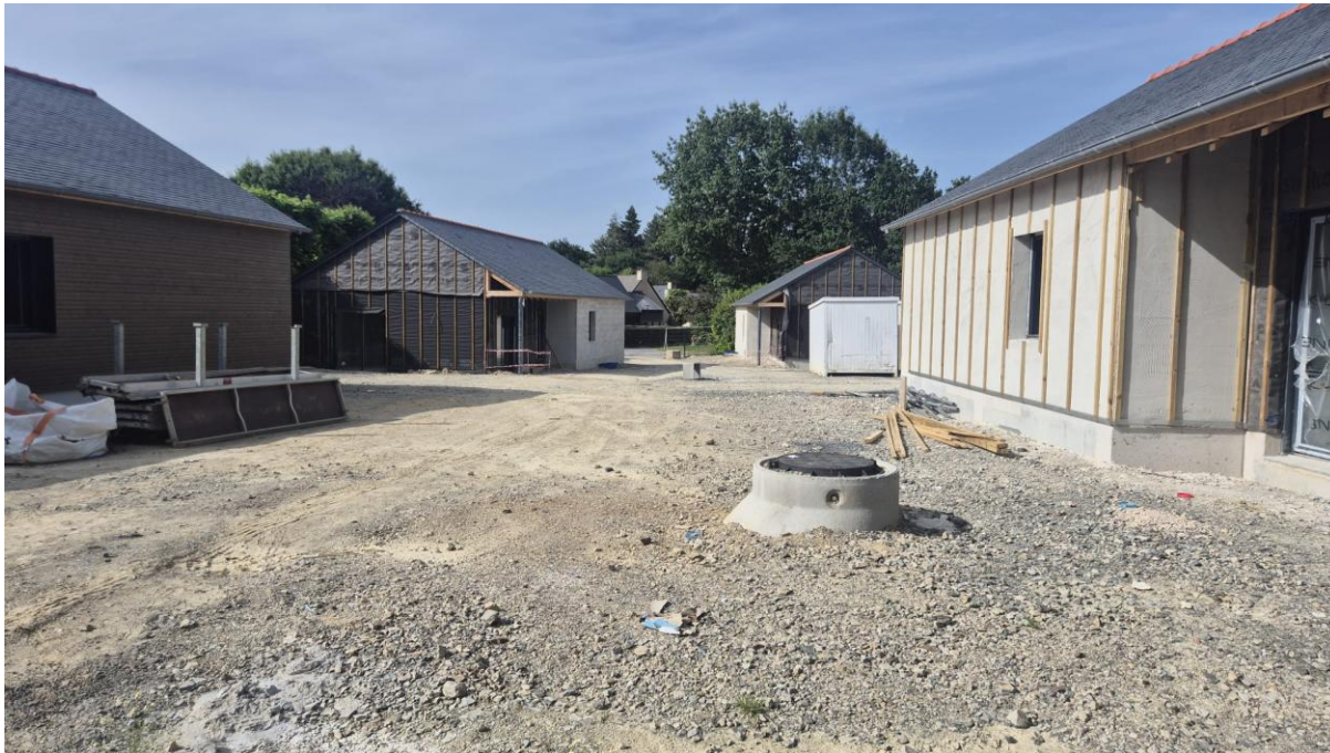
Terrain familial locatif en cours en réalisation à Pacé