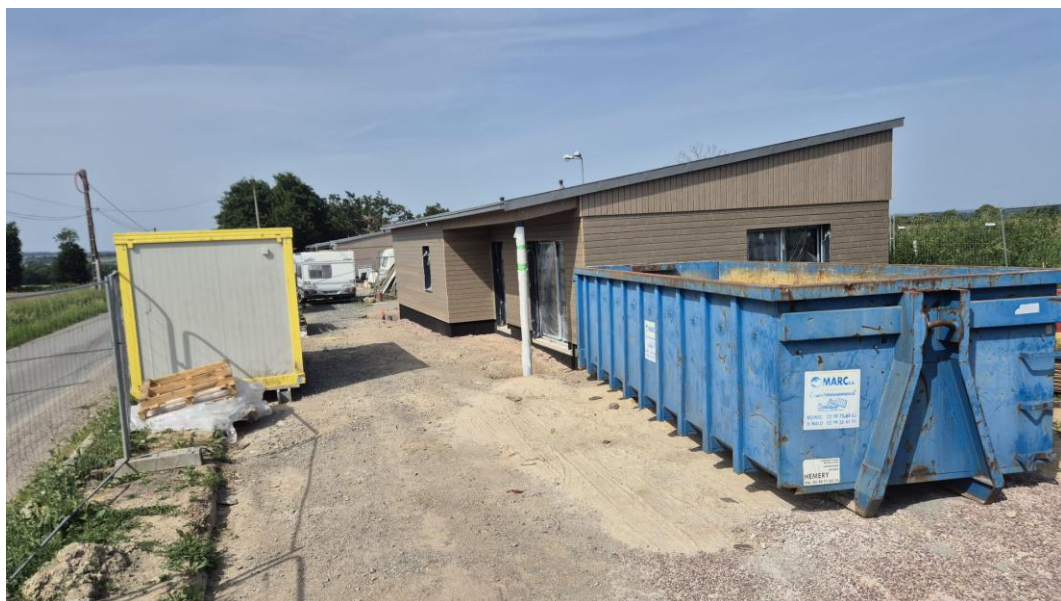
Terrain familial locatif en cours en réalisation à Le Verger